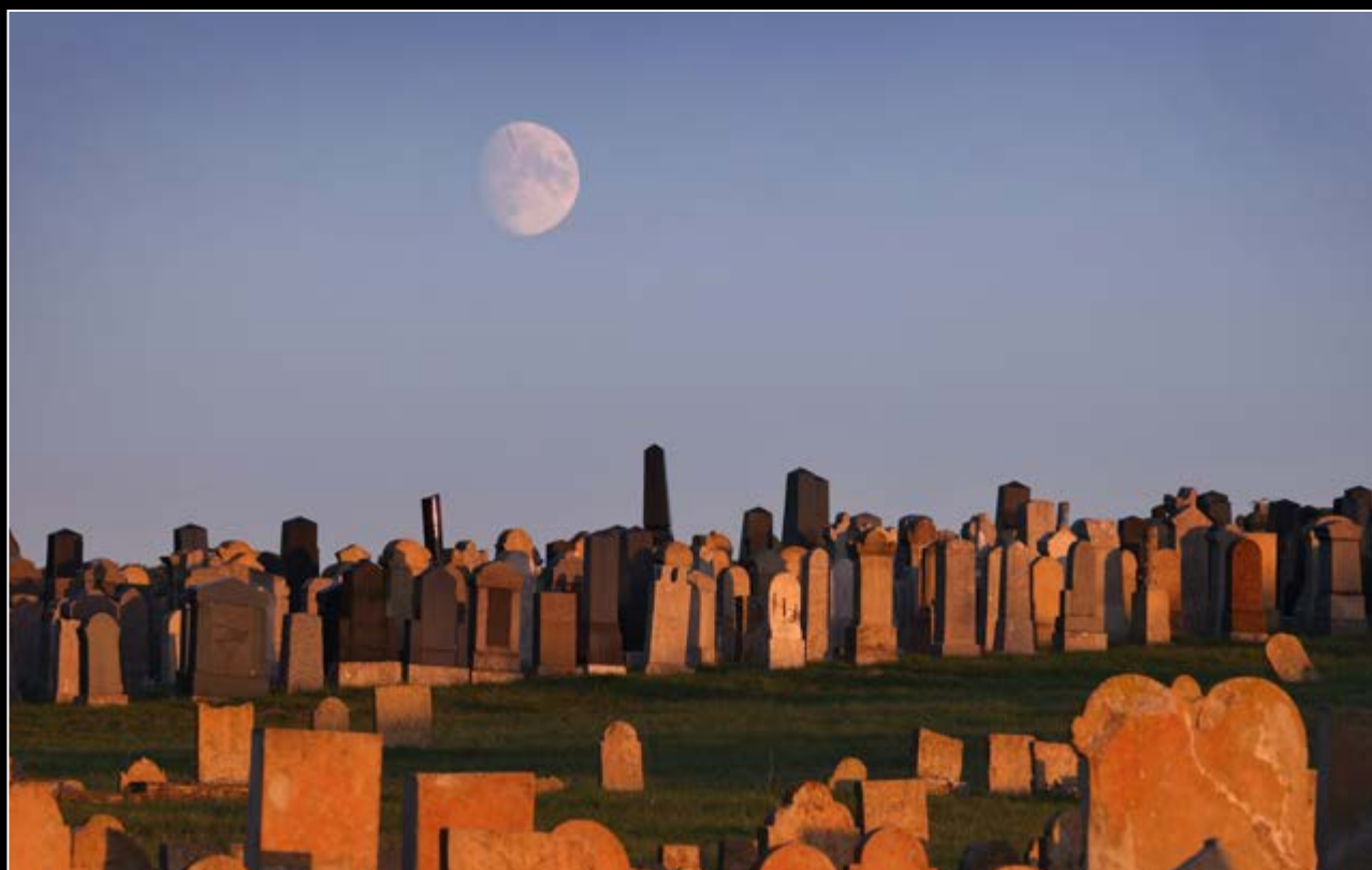
Sieger Kategorie Kultur – Sonderpreis Bayernwerk AG Karl-Josef Hildenbrand: Jüdischer Friedhof

Seit 1991 wird am Untermain American Football gespielt. Die Aschaffenburg Stallions treten am 31. Juli 2022 im Stadion am Schönbusch gegen die Würzburg Panthers an. Das Spiel endet 17:0. Schuhsohlen-Parade eines Spielers während der Pause.