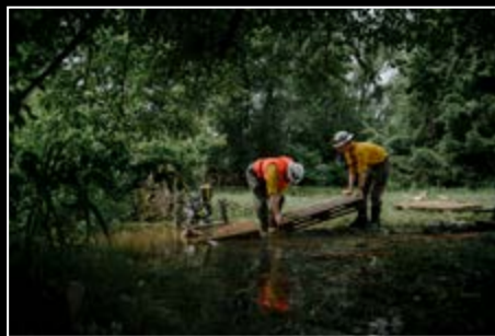
Sieger und Siegerin Umwelt