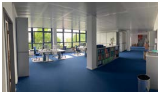
In einigen Ecken der neuen Geschäftsstelle stapeln sich noch Kartons. Gearbeitet wird hier seit Anfang Juni.

Noch ist die erwähnte Veranstaltungsfläche nicht nutzbar. Zusätzlich zu dieser gibt es für formellere Treffen künftig einen großen Besprechungsraum mit Tischen für zirka 20