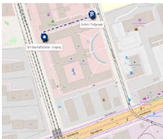
OpenStreetMap - Karte zusammengestellt mit uMap

Wer sich selbst ein Bild der neuen Geschäftsstelle machen möchte, den bitten deren Mitarbeitende um Geduld, einen wichtigen Besuchsgrund und frühzeitige Anmeldung. Noch ist der Eingang in der Aschauer Straße 26 nicht ganz leicht zu finden. Am besten rechts am Haus und der Tiefgarageneinfahrt vorbei gehen, die erste Tür an der Rückseite nutzen und dann in den zweiten Stock hinauf (siehe Karte). Und auch in Sachen Orientierung gibt es mittlerweile Abhilfe: Wegweiser und Schilder mit BJV-Logos wurden kurz vor Andruck des BJVreports installiert. Infos zur Erreichbarkeit unter bjv.de/geschaeftsstelle .