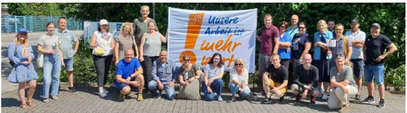
Aus den acht Redaktionen im Zeitungsverlag Oberbayern, die über das Oberland verstreut sind, kamen 25 Redakteur*innen zum Verlagsgebäude in Wolfratshausen. Die Beteiligung am Streik war mit nahezu 50 Prozent hoch, die Redaktionen waren sehr dünn besetzt, meldete Thomas Wenzel.