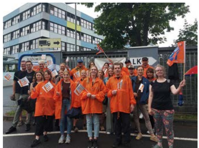
Die Würzburger Main-Post ist nicht mehr tarifgebunden. Deren Haustarif übernimmt die Steigerungen aus dem Gehaltstarifvertrag für Tageszeitungen. Daher hatte der BJV die Redakteur*innen für den 3. Juli zu einem Partizipationsstreik aufgerufen.