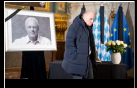
Sieger Land & Leute