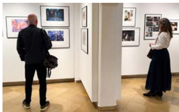
Die Ausstellung Pressefoto Bayern zu Gast im Nürnberger Stadtmuseum Fembohaus.