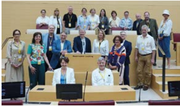
Der Kommunikationsstab des Bayerischen Landtags hat einige Aufgaben, wie eine Gruppe BJVler beim Besuch im Maximilianeum erfuhr.