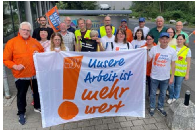
Beim Main-Echo versammelten sich am 3. und 4. Juli 22 Streikende vor dem Verlagshaus. „Die Stimmung geht bei der Redaktionsbelegschaft klar in Richtung Urabstimmung und unbegrenzter Streiks“, sagt Dirk Ceelen.