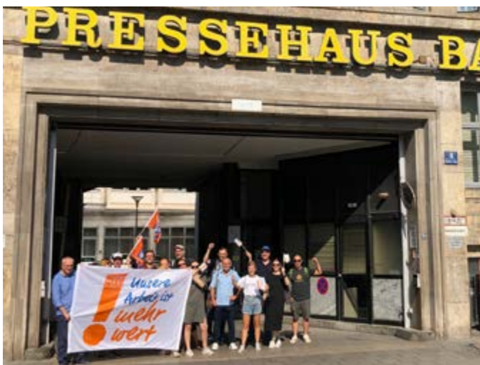
Bei Münchner Merkur und tz (das ist eine Redaktion) streikten etwa 60 bis 70 Redakteur*innen sowie einige Volontär*innen. „Wir sind zu weiteren Streiks bereit, wenn der BDZV nicht endlich einlenkt. Die Motivation ist hoch“, so Dirk Walter.