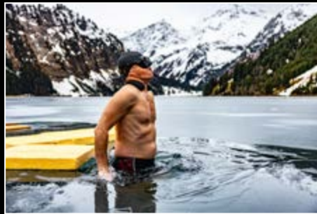
Sieger Newcomer Award