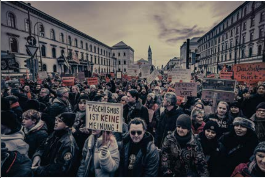
Pressefoto des Jahres 2024