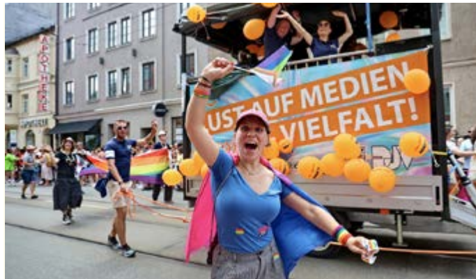
Viel Beifall gab es für den BJV-Wagen bei der CSD-Parade.