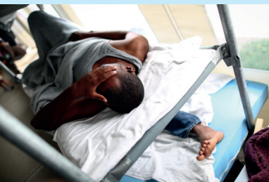
Pressefoto des Jahres 2014 David Ebener: Asylbewerber

Ein einziges Bild kann eine ganze Geschichte erzählen – und das dank des Blickes eines Fotografen im richtigen Augenblick ganz ohne Worte. Auch die Sieger des Wettbewerbs Pressefoto Bayern stehen in dieser Weise für einmalige Geschehnisse. Der kommunale Fotograf ist der beste Chronist seiner Region. Hätten wir sonst etwa erfahren, dass der jährliche Kocherball